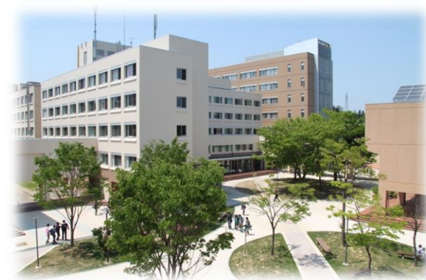
耐震工事や太陽光パネル取付を行った 長岡技大の建物