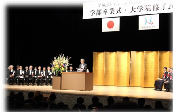
式典（入学式、卒業式等）