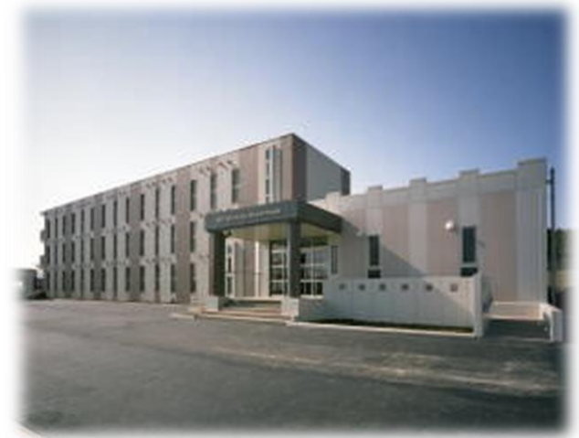
30周年記念学生宿舎