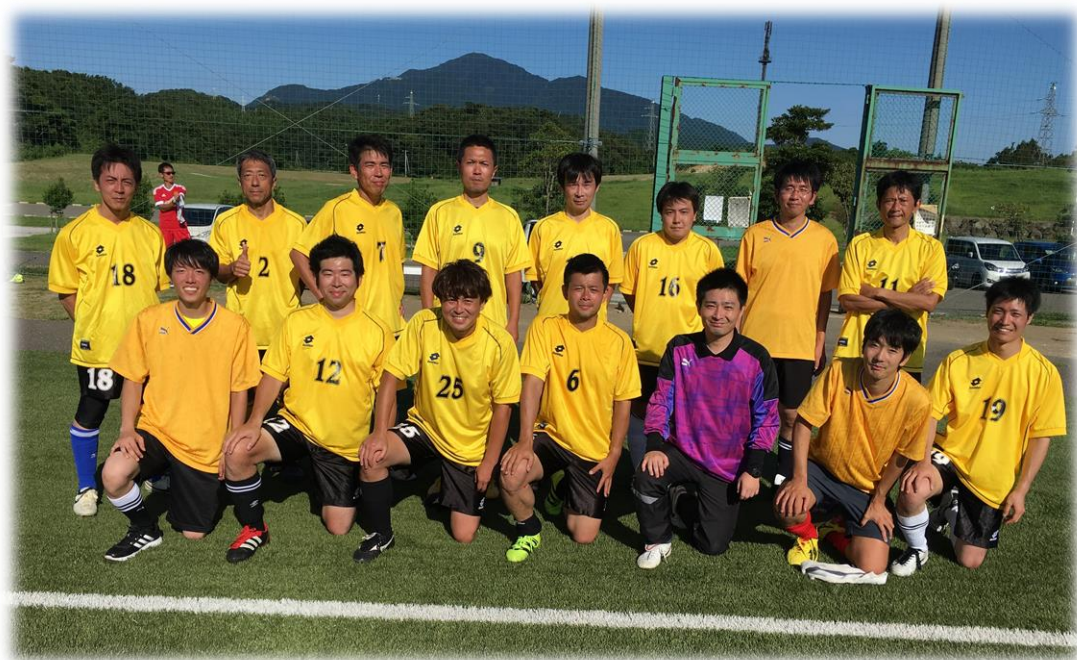
新潟県国立大学法人三大学サッカー大会の様子