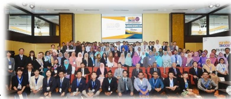
マレーシアでの国際会議にて

若手事務職員の学術交流協定校訪問など (マレーシア、ベトナム、インドネシア、タイ…)