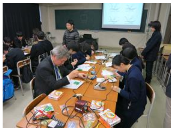
交流会「ライトレースロボット」 (ロボコンプロジェクト)