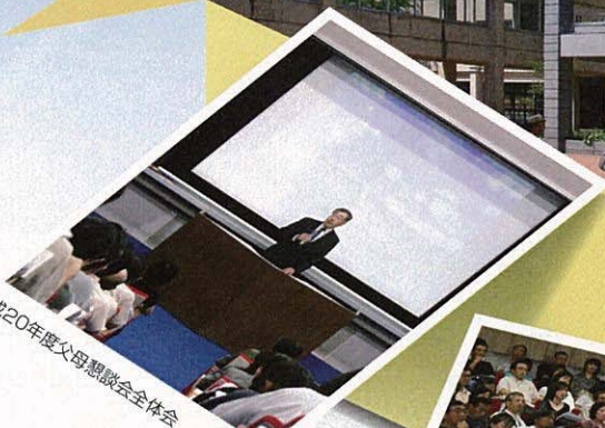
平成20年度父母懇談会全体会