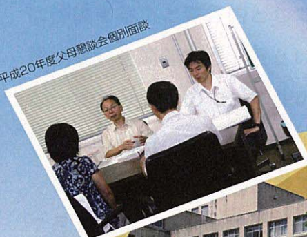
平成20年度父母懇談会個別面談