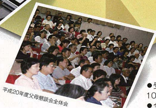
平成20年度父母懇談会全体会