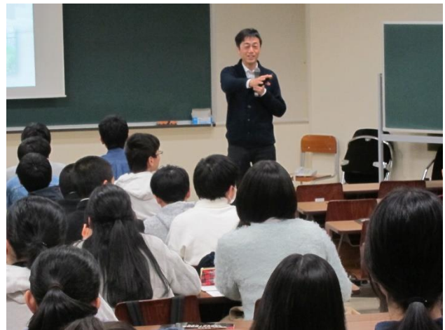
「雪利用最前線 ～食品熟成から データセンターまで～」