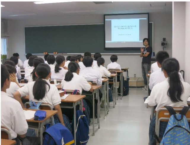
「解けそうで解けない魅力的な数学の未解決問題たち」