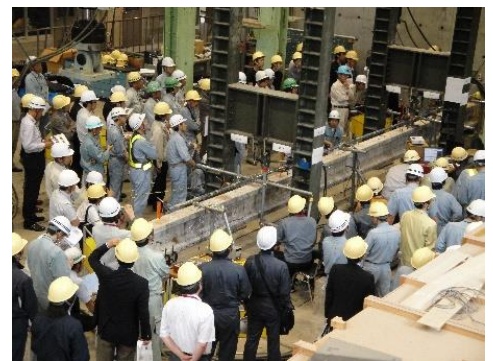
写真-2 橋梁の載荷試験の様子

受賞対象となった論文は、平成 27 年 10 月に土木学会論文集に掲載された「塩害劣化したプレテンション式 PC 桁の載荷試験と解析による耐力評価方法の検討」です。本論文は、日本海沿岸部で約 35 年間塩害環境下にさらされ、鋼材腐食の生じた道路橋を対象として、載荷試験と解析により橋梁の性能評価を行ったものです(写真-2、図-1 参照)。実際の橋梁の調査検討に資する多くの知見を与え、今後の橋梁の維持管理に貢献するものと評価されました。また、本論文は、約 5 年間にわたり本学や長岡高専が地元の技術者の協力を得て行った研究の集大成であります。