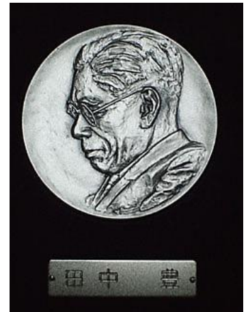
写真-1 副賞のメダル

このうち、私たちは平成 27 年度 土木学会田中賞(論文部門)を受賞致しました。本年の授与式は、平成 28 年 6 月 10 日に土木学会総会(ホテルメトロポリタンエドモント;東京都)において行われ、賞状および副賞のメダルを授与致しました(写真-1 参照)。