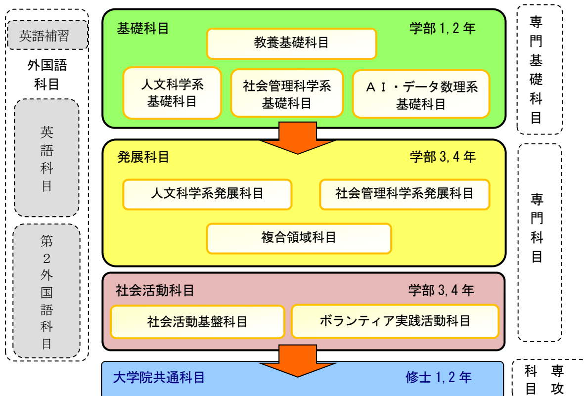
図3 学部から大学院における教養科目・共通科目の教育課程（点線は他の科目群）