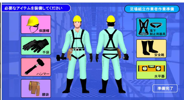
(b) 保護具等装備確認画面