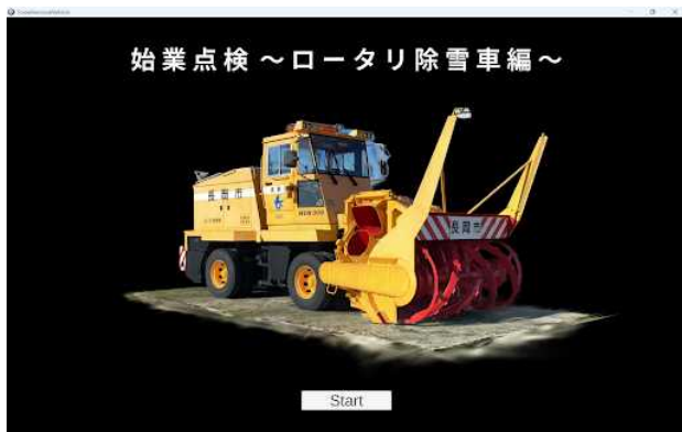
図 1 ロータリ除雪車の始業点検教育ツールの表紙