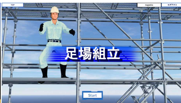
図 4 足場組立作業ゲーム Lite の表紙 (オンライン公開)