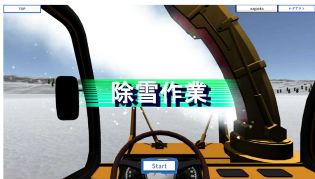
図 3 除雪作業ゲーム Lite の表紙 (オンライン公開)