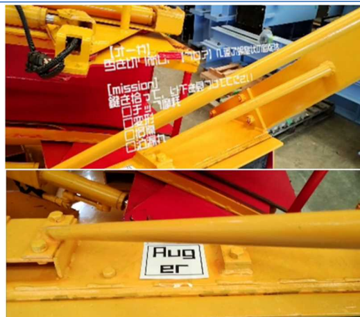
図 2 ロータリ除雪車の始業点検支援ツール