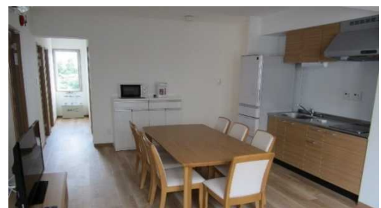
共用ルーム 7 人用