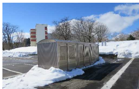
積雪時 共用ごみ捨て場