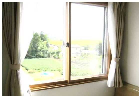
個室から見た外の景色